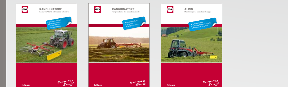
Ranghinatori a singolo gigante